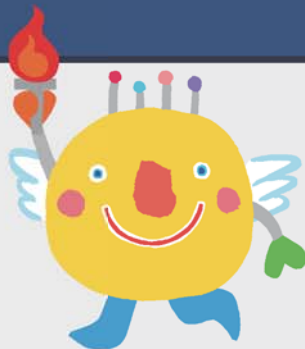
マスコットキャラクター いばラッキー

公益社団法人茨城県歯科医師会はいきいき茨城ゆめ国体 いきいき茨城ゆめ大会のオフィシャルサプライヤーです。