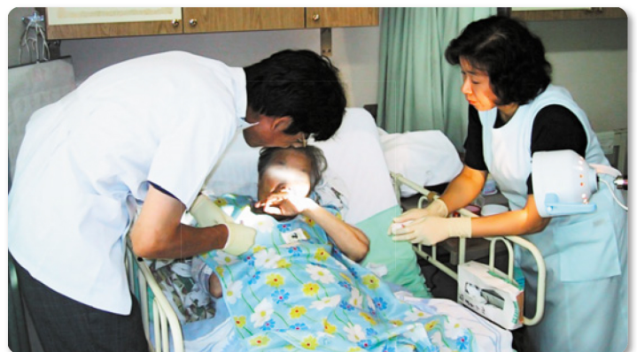
▲訪問歯科診療の様子