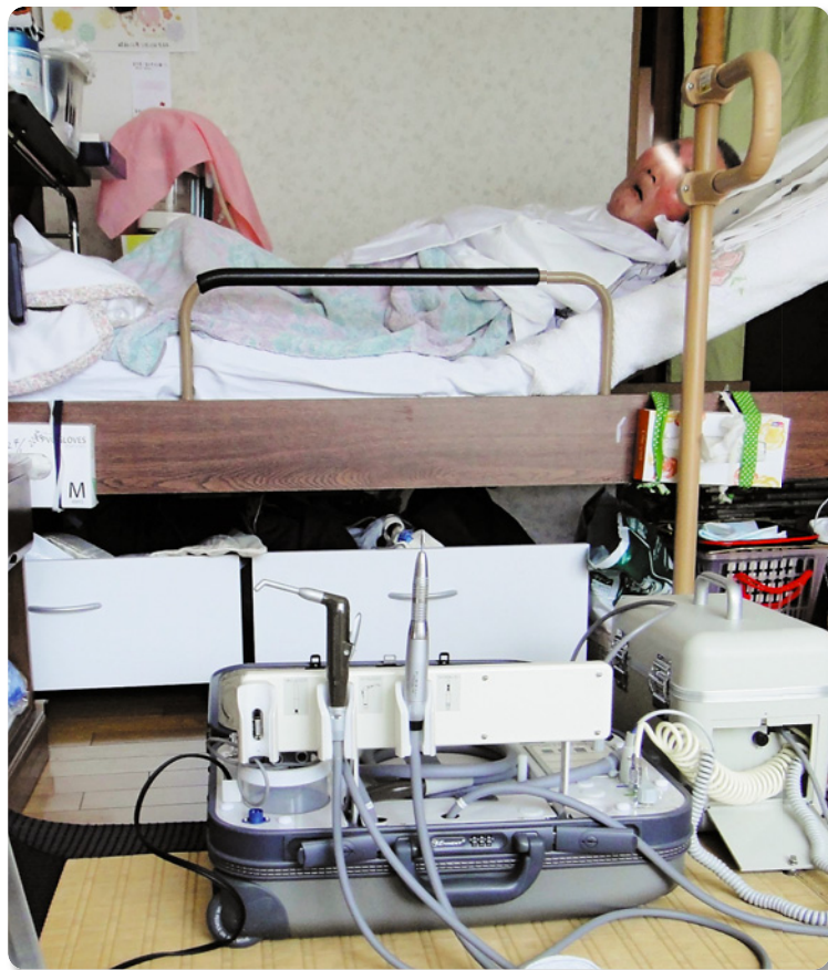
▲寝たきりの方の自宅で訪問診療器械を準備したところ。

個人の全身状態やお口の状態にもよりますが、訪問歯科診療で入れ歯を作ったり、不具合な入れ歯を調整したりしたことで、「噛めるようになった」、「お顔の表情がよくなった」、お口が閉じられるようになって「口内の乾燥が改善した」など、在宅の高齢者の生活の質の向上につながった事例が数多く報告されています。