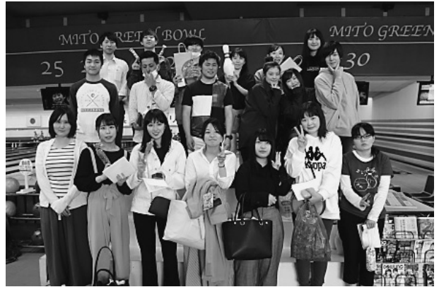
ゲーム後に全員で記念撮影