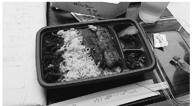
今年から鰻牛そばろ弁当になりました

還暦にもなれば誰しも自分の体の老化を感じるものと思います。しかし何もしなければ心身の衰えは目に見えて明らかです。テニスという生涯スポーツを通して日頃なかなか会えない先生方とお会いし、体を動かすことは日々のストレスから解放され明日への希望を持たせてくれます。今回も学生時代の同級生や後輩、他大学テニス部出身の先生方とお会いし、昔を懐かしく思い出しました。また、いつも全日本歯科テニス大会会場でお見かけする茨城テニス同好会の先生方や、今回初めてお会いした先生方と楽しく一緒にテニスをできたことに感謝いたします。これからも怪我や病気に注意し、できるだけ長く高齢者になってもテニスを楽しめたらと思っています。