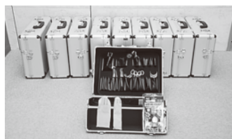
口腔内所見採取キット