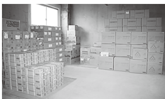
歯科医師会館内の備蓄品