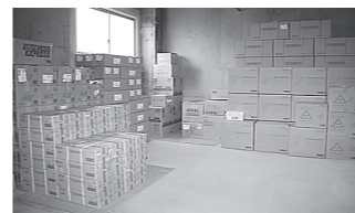
歯科医師会館内の備蓄品