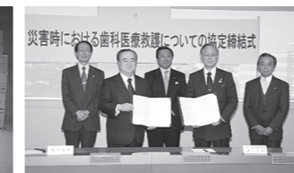
茨城県との協定締結